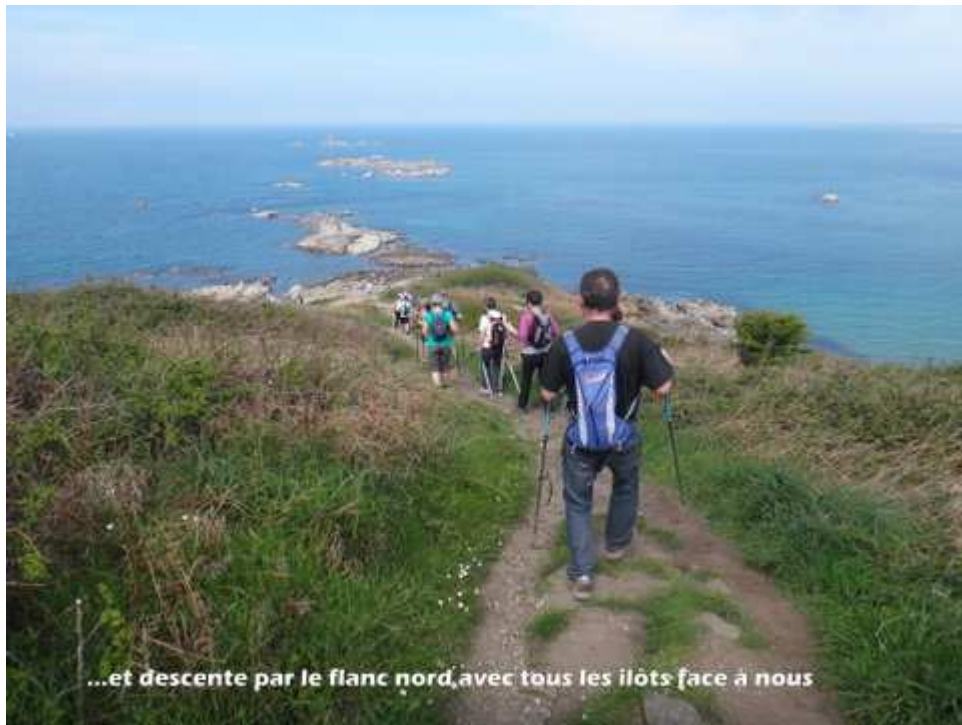
— 07-DSC08908.JPG —