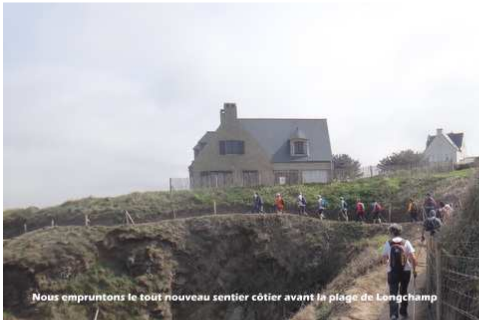
— 09-DSC08910.JPG —