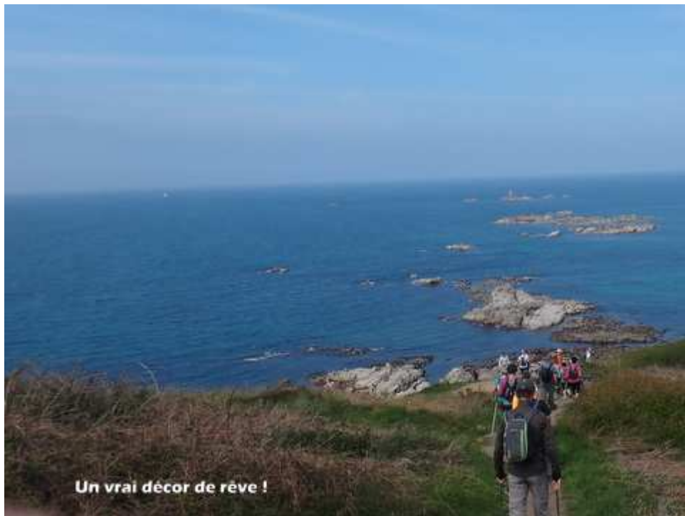
— 08-DSC08909.JPG —