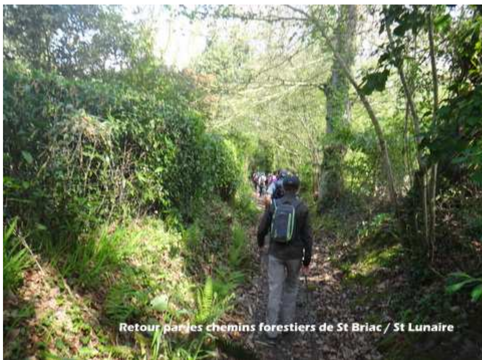
— 10-DSC08911.JPG —