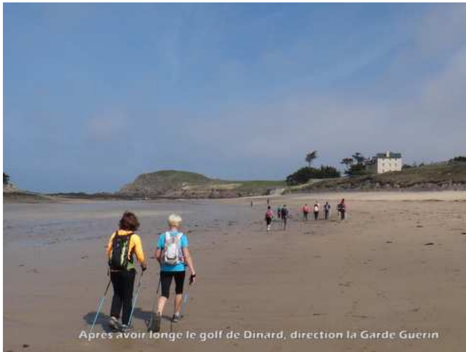
— 03-DSC08903.JPG —