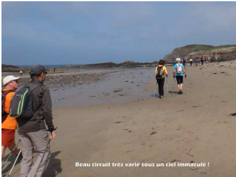
— 04-DSC08904.JPG —